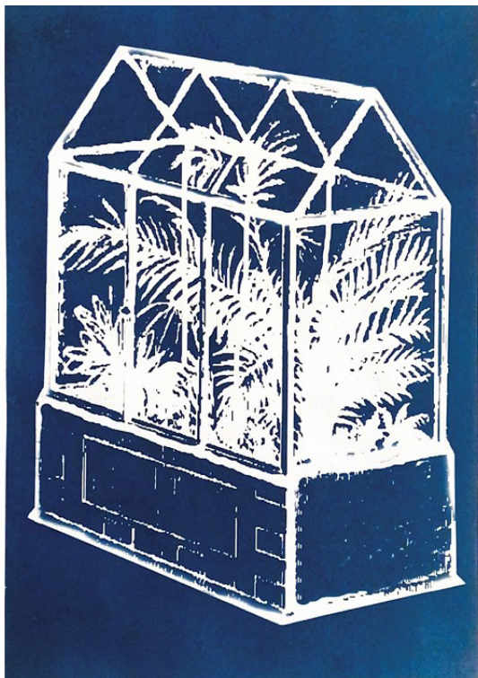
Caisse de ward, 2021 cyanotype, 29,7cm x 42 cm