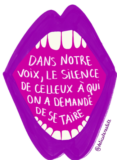
Dans notre voix, le silence de ceux à qui on a demandé de se taire, 2025.

Pensées comme des outils de diffusion et d'appropriation, ces affiches sont mises à disposition gratuitement et téléchargeables librement sur le site internet du collectif. Elles ont vocation à circuler, à être imprimées, affichées et réutilisées dans différents contextes militants. Dans cette même logique de partage, le collectif distribue également gratuitement des affiches et des flyers lors de manifestations, contribuant ainsi à renforcer la visibilité des luttes sur le terrain et à soutenir les mobilisations en cours.