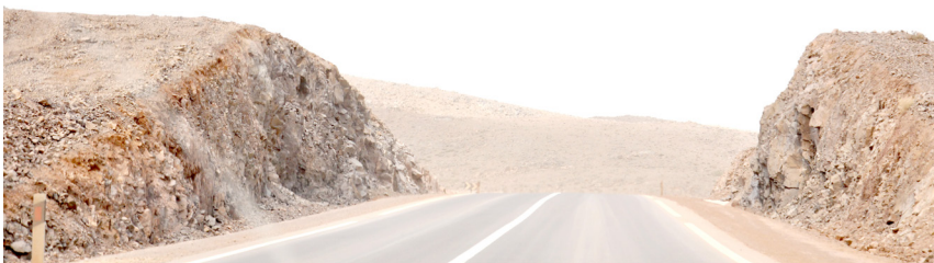
Disparition topographique - Ligne de chute d'un réel, 2025. photographie numérique, tirage argentique sur papier fine art, 30 x 40 cm. ©alice didier champagne

Alice Didier Champagne est née en 1983. Elle vit et travaille à Malakoff. Tout en jouant sur la frontière entre fiction et réalité, son travail interroge des situations, des espaces, qui appellent à la projection, aux représentations et au questionnement, la pratique d'Alice Didier Champagne est intimement liée au déplacement. In-situ, elle adopte une position particulière, celle d'artiste-touriste. Ainsi, par le biais de l'humour, du décalage ou de la poésie, elle questionne les notions d'image et de miroir. Elle choisit les lieux qu'elle arpente pour leurs dimensions hétérotopiques, utopiques ou politiques ainsi que pour leurs H(h)istoires faites de fantasmes et de clichés. Elle aime jouer avec la/sa réalité, la faire basculer dans un ailleurs. Au sein d'un paysage, Alice Didier Champagne imagine un scénario, en prélève des fragments, qui mettent en avant une contradiction, une absurdité. Ces fragments sont des éveilleurs de fictions qui sont inclus dans l'espace plastique qu'elle construit. Chaque pièce est conçue comme un arrêt sur image, ce qui laisse place à un avant et un après. Elle crée des espaces où le paysage est instigateur mais également prétexte à interroger les liens qui se tissent entre territoires et identités.