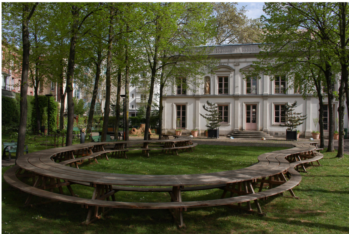
Olivier Vadrot, La table sans fin, 2025.

La ville de Malakoff a inauguré le 1er juin 2017 un verger dans le jardin du centre d'art. Différentes variétés d'arbres et d'arbustes y sont plantées et offrent des fruits à cueillir du mois de février au mois de novembre : pommes, pêches, poires, prunes, figues, raisins grimpants, mûres et fraises des bois au sol. Le jardin se dote aussi d'une pelouse de trèfles, de jeux pour enfants et de deux composteurs.