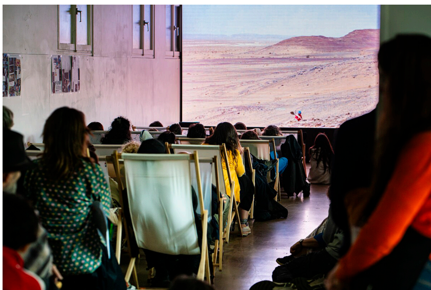
Nuit blanche, centre d'art contemporain de Malakoff, 2025, crédits photographiques Fabien Venturi.

La soirée se clôture avec la projection du film In the Mood for Love de Wong Kar-wa, une histoire d'amour et de non-dits, portée par la lumière de Maggie Cheung et Tony Leung.