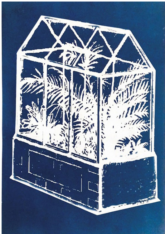
Caisse de ward, 2021 cyanotype, 29,7cm x 42 cm