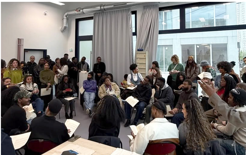
Misomo_02 Lecture de l'edito et lancement de la revue de misomo numero 01.