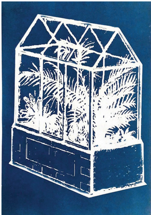
Caisse de ward, 2021 cyanotype, 29,7cm x 42 cm