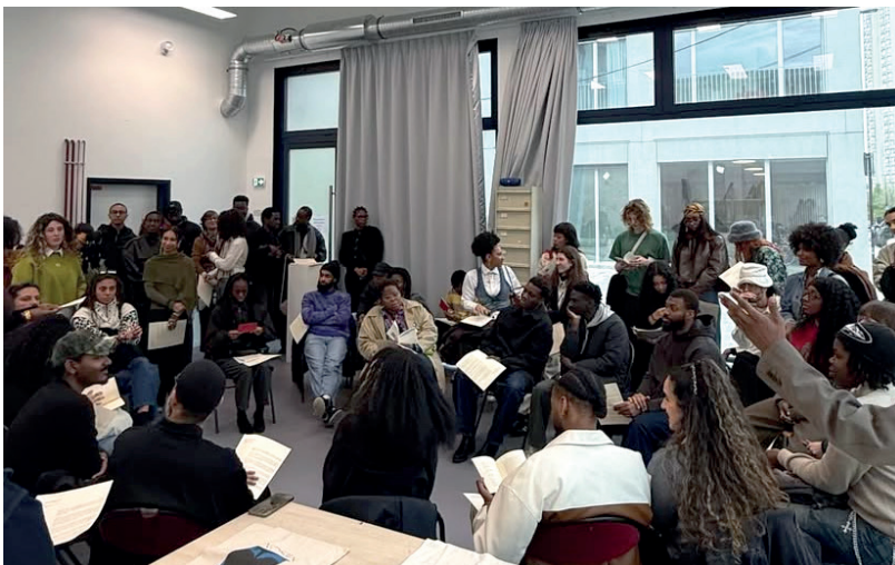
Misomo_02 Lecture de l'edito et lancement de la revue de misomo numero 01.