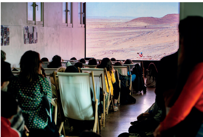
Nuit blanche, centre d'art contemporain de Malakoff, 2025, crédits photographiques Fabien Venturi.

La soirée se clôture avec la projection du film In the Mood for Love de Wong Kar-wa, une histoire d'amour et de non-dits, portée par la lumière de Maggie Cheung et Tony Leung.