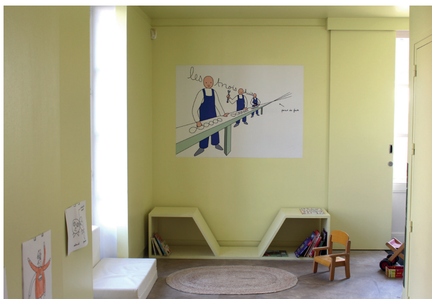
Vue de la pépinière sur le site maison des arts, centre d'art contemporain de Malakoff. Cycle Les moulineuses avec l'œuvre de Louise Pressager.

Le pôle médiation et éducation artistique du centre d'art propose une visite contée au rythme des bébés accompagnés de leurs parents. Venez découvrir en compagnie d'un-e médiateur-ice des contes autour des expositions sur le site maison des arts. Une visite ludique et sensorielle qui s'adapte aux besoins des plus jeunes comme à celui des parents. public : 0-3 ans avec leur famille.