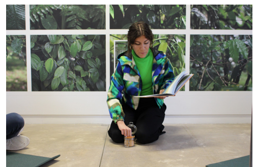
Vue de la visite contée 6 décembre 2025, © centre d'art contemporain de Malakoff.

Vanyan* : signifie brave en créol haïtien.