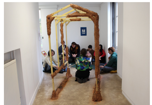
Vue de la visite contée 6 décembre 2025, © centre d'art contemporain de Malakoff.