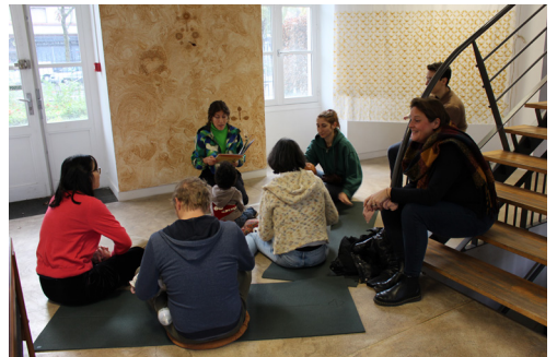
Vue de la visite contée 6 décembre 2025.

Vanyan* : signifie brave en créol haïtien.