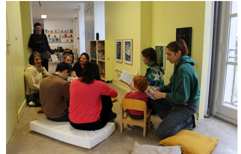
Vue de la visite contée 6 décembre 2025, ©centre d'art contemporain de Malakoff.

Aussi, Bolong-Bolong, jaloux du don de la famille de Tana, a volé leur voix. Tout le monde devint muet et ne pouvait plus communiquer avec les plantes. Tana essaya en vain de les aider à combattre ce terrible sort qui les avait attaqués mais le mal était tellement répandu qu'il rongea tout, jusqu'au bois de leurs maisons.