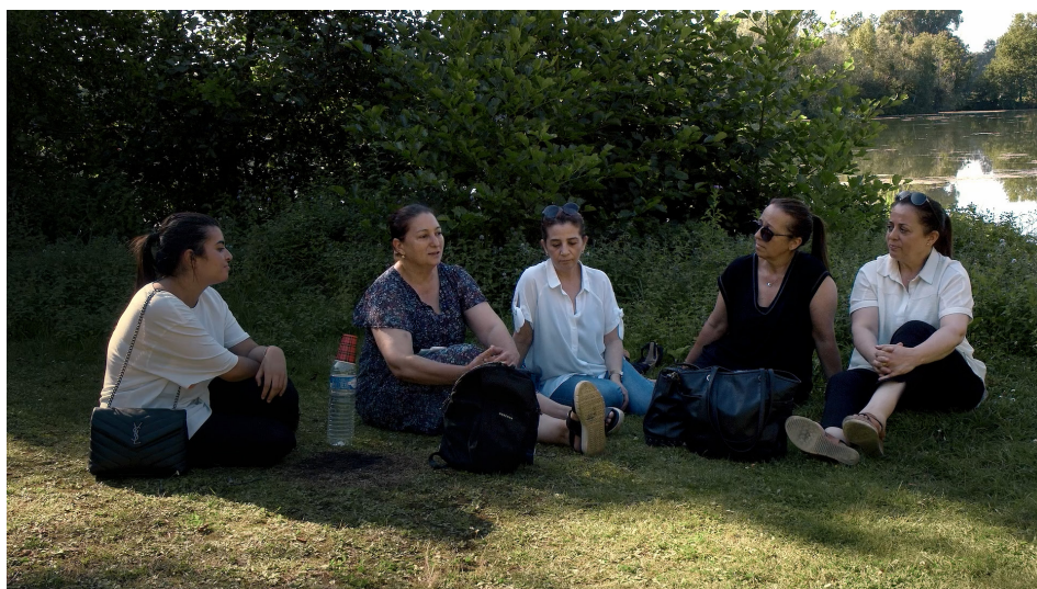
Rayane Mcirdi, Le Jardin , 2021, vidéo, 22min 29sec. Film produit avec le soutien de l'école municipale des Beaux-Arts Galerie Edouard-Manet et la ville de Gennevilliers. Courtesy de l'artiste et de la Galerie anne Barrault, Paris.