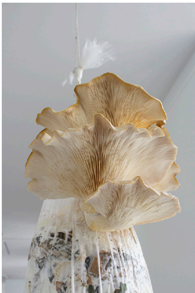
Myciculture , 2023, composés de mycéliums de pleurotes grises, marc de café, coupeau. Projet Couper les fluides , février à juillet 2023. © Anouck Durand-Gasselin.

Depuis le 13 février, la champignonnière est réalisée grâce à l'aide des agents du service reprographie et du service culturel de la ville.