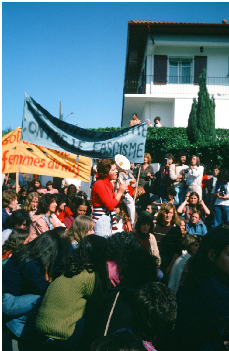
Marche des femmes à Hendaye. 5 octobre 1975.

Mille femmes venues de toute la France se rassemblent à Hendaye le dimanche 5 octobre 1975, contre les exécutions de militants basques par le régime franquiste. Des femmes Espagnoles exilées en France participent à la marche, tout comme des femmes françaises, brandissant des banderoles en basque, en français et en espagnol. Des femmes basques entonnent des chants basques en marchant vers la frontière.