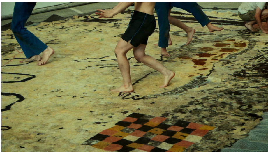
Le grand feutre , 2022, vidéo, 13 min.

En résidence avec le collectif Adventices à Malakoff, d'avril à juillet 2024, Théophile Peris relance la fabrication collective avec les habitant·e·s, d'un grand feutre le 15 juin 2024 à la supérette.