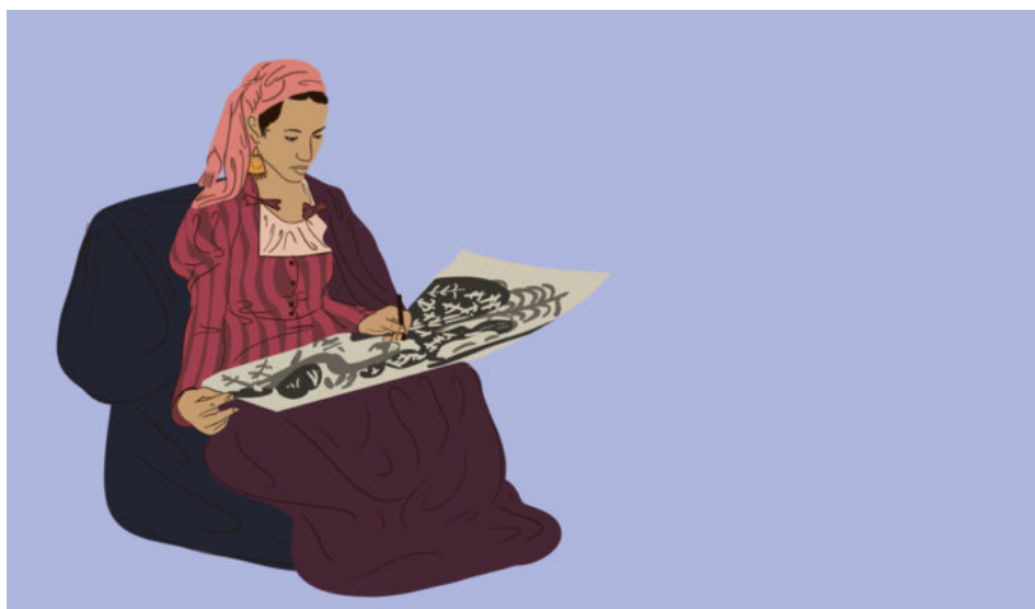
Petites histoires de grandes artistes, 2023. Vidéo, 5min17.