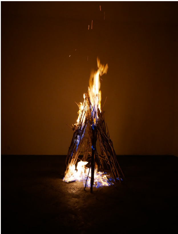
Mouvement Primaire , performance, essence sur bois divers, 170cmX100cm, 2023. © Jonathan Potana.

Ce moment festif et artistique, se déroulera en symbiose avec la Fête de Quartier du Sud de Malakoff organisée par la Maison de quartier Henri-Barbusse. Ce projet est pensé en collaboration avec l'espace Y grec - centre d'art de l'École nationale supérieure d'arts de Paris-Cergy, situé sur la commune d'Aubervilliers.