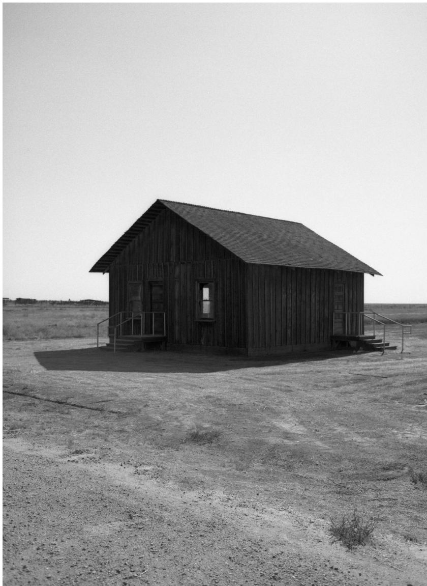
Carter House, 2024. Photographie, 100 x 73 cm.

Nelson Bourrec Carter est un artiste et réalisateur Franco-Américain dont la pratique articule film, photographie et installation. Ayant grandi en Île-de-France, il interroge son héritage afro-américain et ce que l'apprentissage d'une culture à la fois intime et étrangère suppose de fantasme, d'appartenance négociée et d'appropriation. Il s'intéresse aux objets de culture populaire tels que les séries et l'histoire du cinéma, plus particulièrement dans leur rapport aux représentations minoritaires et au traitement du paysage, qu'il soit urbain, périurbain ou rural. Ses films ont été montrés dans des festivals tels qu'Entrevues Belfort, Vila do Conde ou les Rencontres Internationales Paris/Berlin, à la Cinémathèque Française, mais également dans des institutions comme le MAC VAL ou le MoMA de New York.