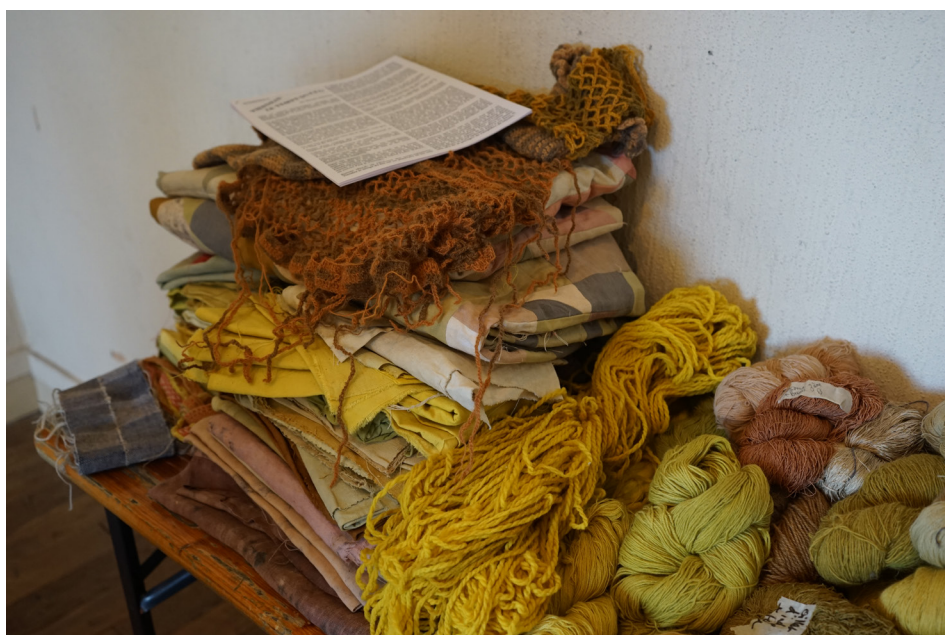
Pelottes de laine teinture naturelle, 2023. © collectif Adventices.

En résidence à la supérette, le collectif poursuit certaines recherches en petit groupe (production, édition, illustration, texte). Leurs recherches à partir des plantes à couleurs dites tinctoriales, ainsi qu'autour de la laine. Leur résidence s'articule autour de temps d'apprentissage et d'expérimentation. Le collectif propose de temps de partage de leurs recherches avec les citoyen-ne-s : Le 27 avril un moment de rencontre, de lectures et d'initiation à la teinture naturelle. Le 15 juin portera sur la réalisation d'un grand feutre collectif et le 6 juillet fera place à une restitution de l'ensemble de leur résidence, avec la présentation d'un fanzine édité afin de transmettre au habitant·e-s et citoyen·ne-s les savoirs appris.