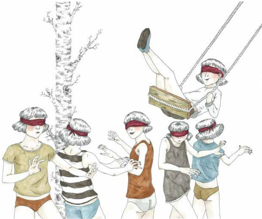
Laura Bottreau & Marine Fiquet ; Elles avaient les mêmes yeux , détail 5, 2016 ; série de 7 dessins ; encre de chine et feutres ; coproduction centre d'art contemporain de Pontmain ; © Adagp, Paris 2018