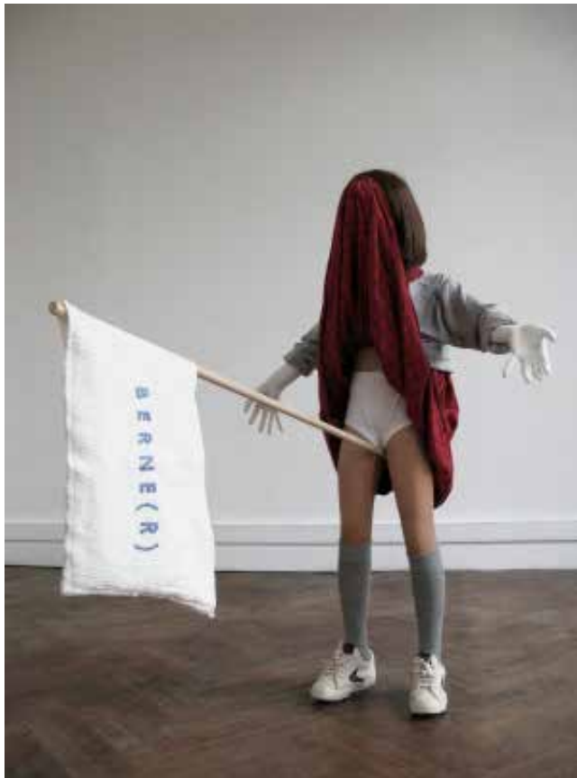
Laura Bottreau & Marine Fiquet ; Berne(r) , 2017 ; matériaux divers ; 135 x 80 x 167 cm ; coproduction MPVite ; © Adagp, Paris 2018

Elles avaient les mêmes yeux rassemble des fillettes, toutes semblables, contemplant leur propre mise en scène, miroir d'une réalité qui leur échappe. Les motifs architecturaux construisent un décor flottant comme « pièce », entre l'espace clos et l'espace théâtral. Actrices et spectatrices d'un théâtre qu'on ne leur donne pas à voir, la violence narrative exerce un contrepoint punitif à l'expectative du regard. Et les spectatrices, visages glissant, regrettent déjà les coulisses.