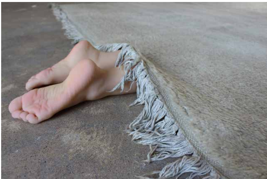
Laura Bottreau & Marine Fiquet ; Les vieux démons , détail, 2018 ; installation ; matériaux divers ; dimensions variables ; coproduction maison des arts, centre d'art contemporain de malakoff ; © Adagp, Paris 2018