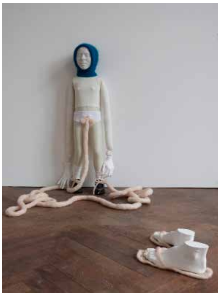
Laura Bottureau & Marine Fiquet ; Douces indolences , 2017; installation, porcelaine, laine, plâtre, textiles, résine ; dimensions variables ; coproduction MPVite ; © Adagp, Paris 2018