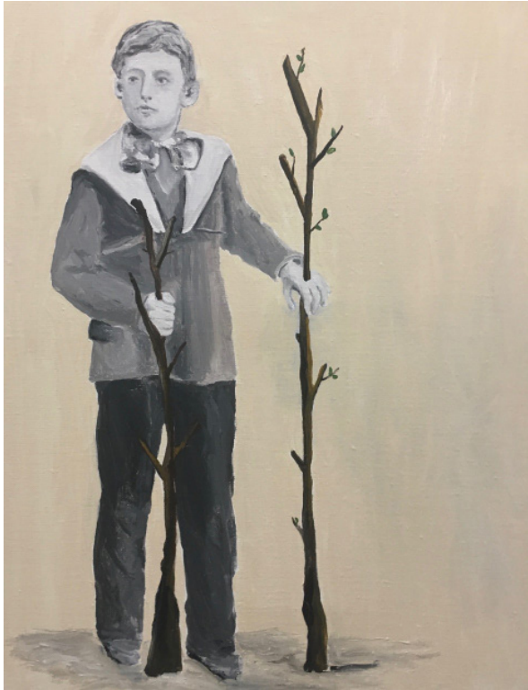
Edi Dubien « Branches guerrières » 2017 peinture sur toile 40 x 50 cm