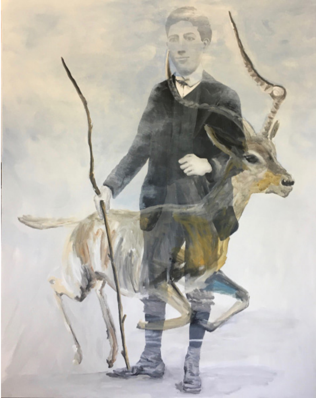
Edi Dubien « Passage » 2017 peinture sur toile 162 x 130 cm