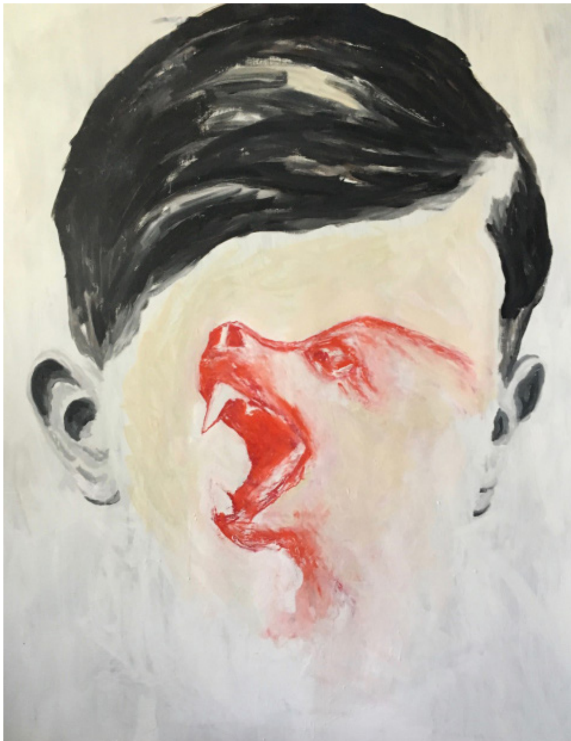
Edi Dubien « Voyage d'un animal sans mesure » 2017 peinture sur toile 226X180 cm