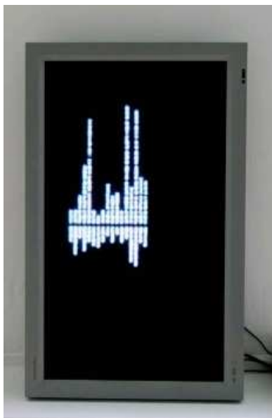
AUDREY MARTIN Générique , 2009 Vidéo, 4 min 38