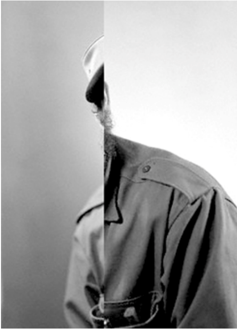
Les ambitieux #12, 2008 Tirage Lambda couleur, 18 x 13 cm