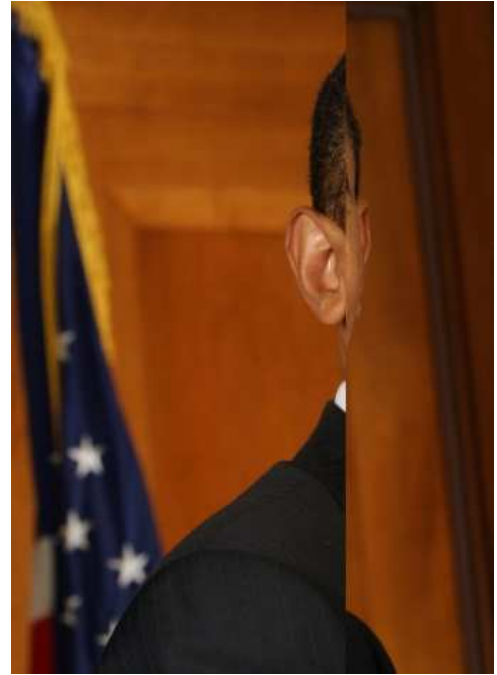
Les ambitieux #25, 2008 Tirage Lambda couleur, 18 x 13 cm