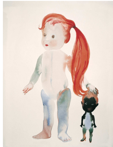
Poupées , encre sur papier, 2005-2006