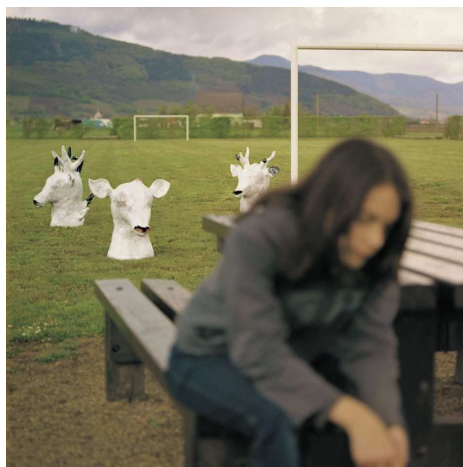
Mes familiers , photographie, 2005

Possibilité d'autres visuels sur simple demande en 300dpi, format JPG.