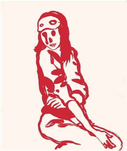
Rougir , sérigraphie, 2005