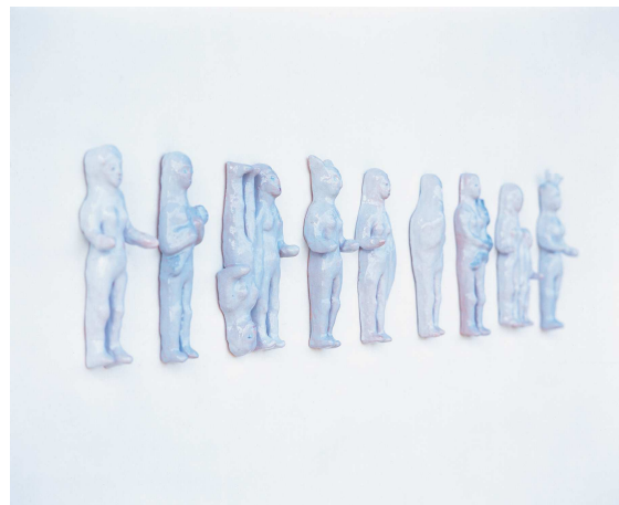
Elles , 9 figurines en céramique, 2004