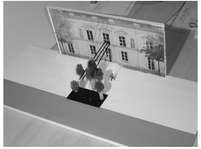
Paysage avec cascade , projet pour installation extérieure à la Maison des Arts