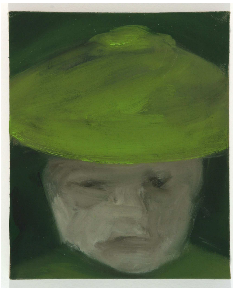
Sans titre , 2004 Huile sur toile, 27x22 cm.