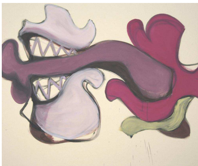
X14, 2004 Acrylique sur toile, 162x195 cm.