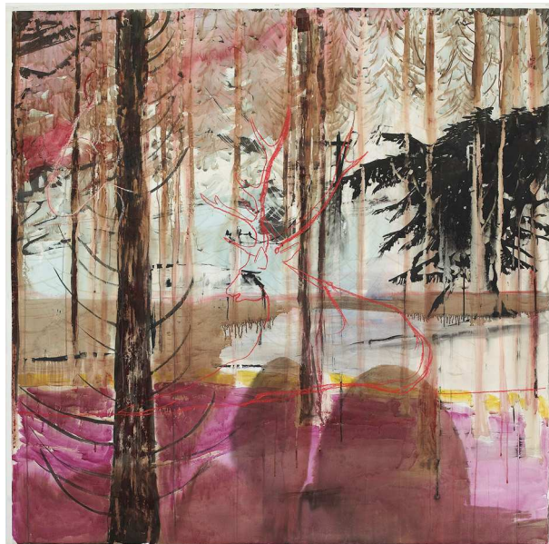
Sans titre . 2004

2001 Aide individuelle à la création Drac Limousin