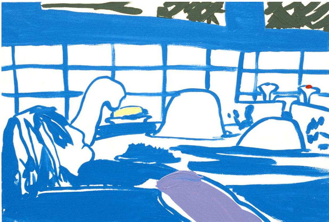
Taking a bath jack , 2004. Huile sur toile, 35x52 cm.