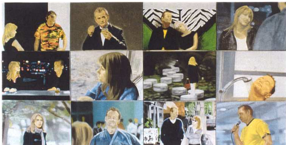
Lost I , 2004 Huile sur toile 115x220 cm

1995 Aide individuelle à la création, Drac de Basse Normandie.