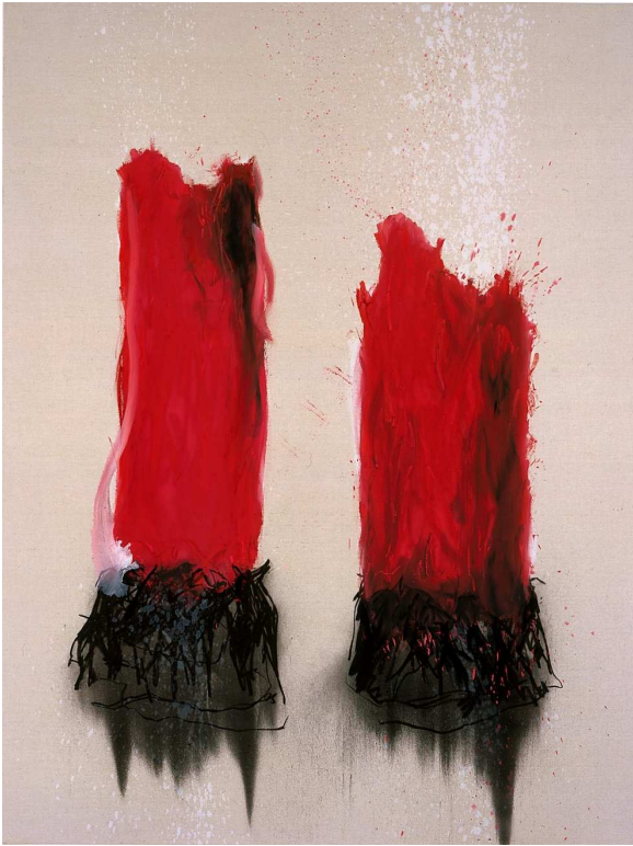
Jour de colère/Pas de tristesse 2004 Fusain et huile sur toile 185x140 cm