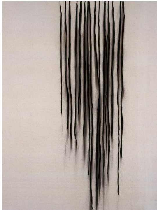
Suspens 2004 Fusain sur toile 185x140 cm