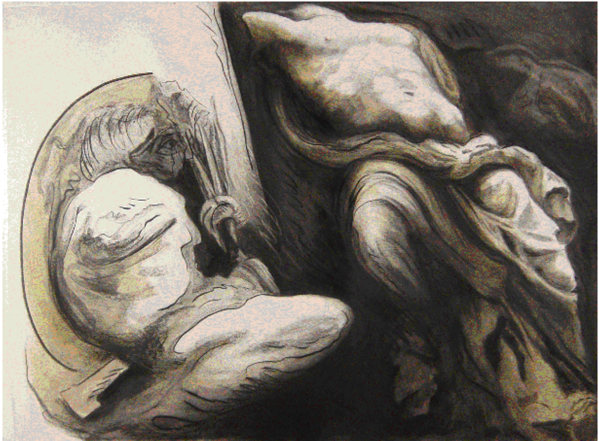
Sans Titre, 2002. Fusain sur papier préparé, 120x160 cm.

LIONEL GUIBOUT De Pergame à nos jours Du 18 janvier au 2 mars 2003