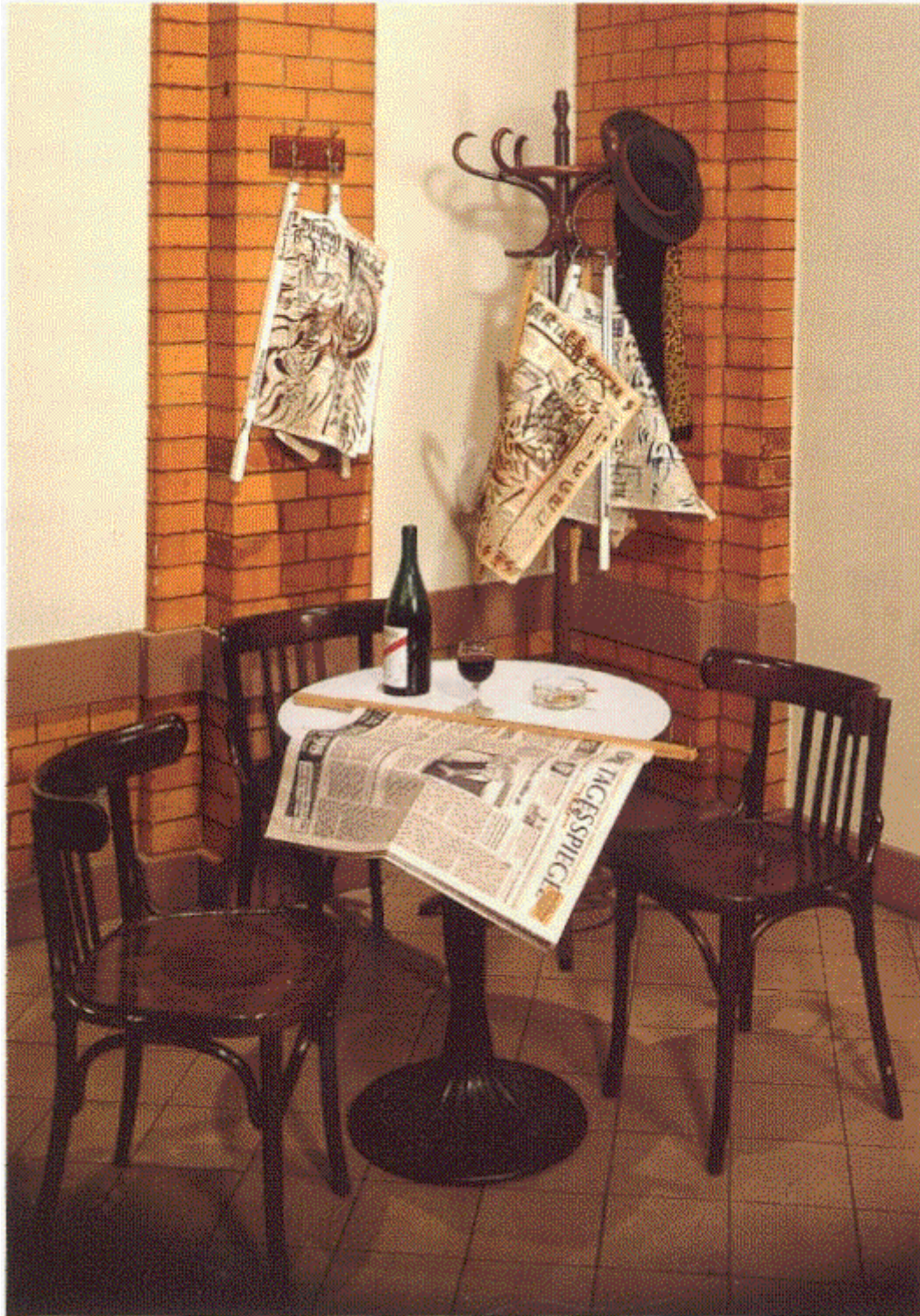
Vue de l'installation « Le Temps suspendu », 1998.