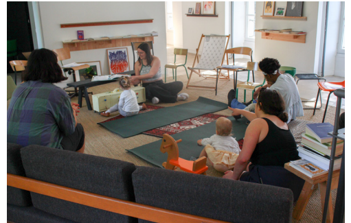
Vue de la visite contée 23 mai 2026, ©centre d'art contemporain de Malakoff.

Ainsi, certaines abeilles commencèrent à déposer des pétales colorés dans leur alvéole, et à disposer du pollen de toutes les couleurs. Petit à petit, de plus en plus d'abeilles se prêtèrent au jeu. Finalement, en voyant la joie et la fierté de toutes ces abeilles dans leurs intérieurs colorés, mêmes les plus travailleuses firent une pause dans leur journée. Elles se mirent à leur tour à emprunter, puis à disposer des pétales et du pollen dans plusieurs espaces de la ruche.