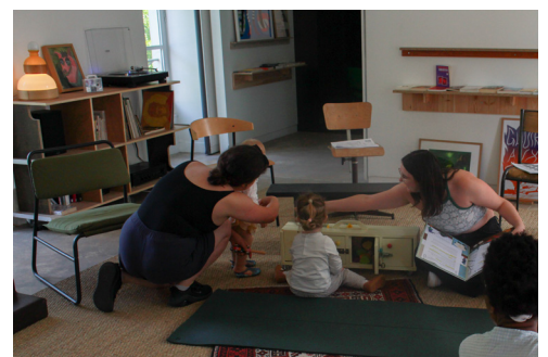
Vue de la visite contée 23 mai 2026, ©centre d'art contemporain de Malakoff.