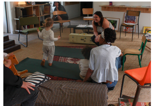
Vue de la visite contée du 23 mai 2026, ©centre d'art contemporain de Malakoff.