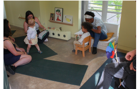
Vue de la visite contée du 23 mai 2026.

“Ah, Anna ! Tu es enfin là ! On a besoin de toi tout de suite. Il nous manque des abeilles éclaireuses et butineuses pour aujourd'hui. Tu veux bien venir avec nous pour nous aider ?”