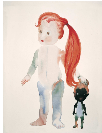
Poupées , encre sur papier, 2005-2006