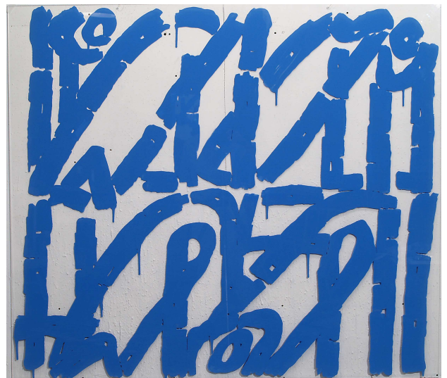
Acrylique sur plexiglas, 2003

Possibilité d'autres visuels sur simple demande en 300dpi, format JPG.