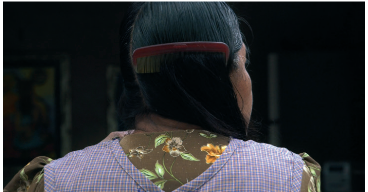
La Libertad , film HD, 30 mins, 2017

Laura Huertas Millán construit ses projets comme des laboratoires politiques. Dans ses films, les relations humaines et non humaines sont considérées et déplacées à travers le jeu d'acteurs et la situation de tournage filmique, perçue comme un état modifié de conscience.